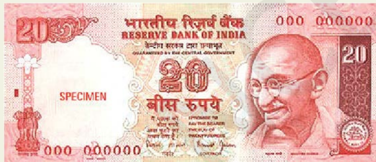
20 रुपये का नोट