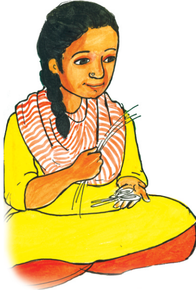
मिली की मम्मी