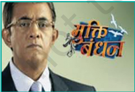
आँखे बोलती हैं...सत्ता स्रोत — मुक्ति बंधन से एक चित्र

क्या सभी पुरुष सिर्फ़ इसी तरह से व्यवहार करते हैं अथवा क्या अब चलन बदल रहा है? इस विषय पर समूह में चर्चा करें