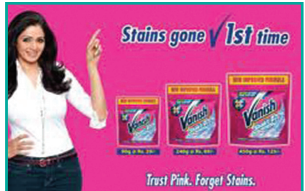
प्रचलित विज्ञापन—रूढ़िबद्धता को दर्शाते हुए