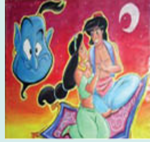
एक प्रचलित बाल कार्यक्रम— अलादीन

जेंडर रूढ़िबद्धता हमारी संस्कृति में बच्चे के टीवी देखने अथवा कहानियाँ पढ़ना आरंभ करने के आरंभिक चरण से ही बैठा दी जाती हैं। अनेक बाल फ़िल्मों में शक्तिशाली पुरुष नायक होते हैं। भले ही निर्माता जानबूझकर जेंडर असंवेदी वक्तव्य न बना रहे हों, लेकिन वे जो कुछ भी निर्मित करते हैं उसे लाखों लड़कों और लड़कियों द्वारा देखा जाता है। ये देखकर कि पुरुष अंत में हीरो ही बनेगा और महिला पतली, गोरी, निर्मल मन वाली लड़की होगी जिसे रक्षा की आवश्यकता है, कम आयु में बच्चों के मन में रूढ़िबद्धता को अंकित कर देते हैं।