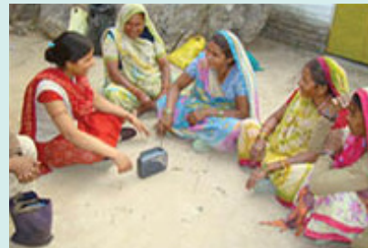
मुझे सशक्त करो !!!