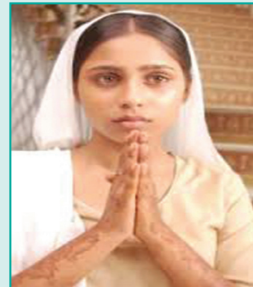
सदैव निर्भर और वंचित