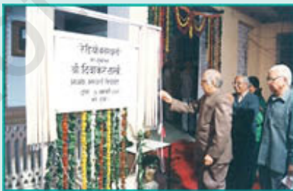
वनस्थली विद्यापीठ में कम्युनिटी रेडियो का उद्घाटन