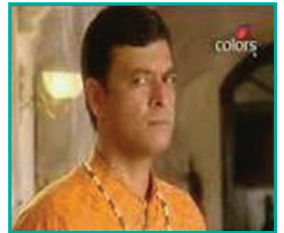
स्रोत— बालिका वधू से एक चित्र)